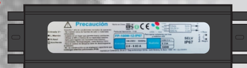
VISTA SUPERIOR LADO DE ETIQUETA

RECOMENDACIONES : UTILIZAR AL 80% O MENOS DE SU CAPACIDAD MAXIMA