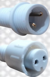
IMAGEN DETALLADA DE CONECTORES ENTRADA - SALIDA